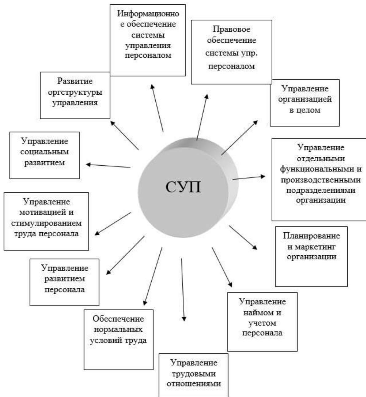
Рисунок.1 - Состав подсистем системы управления персоналом организации

Анализ системы управления человеческими ресурсами и диагностика персонала включает в себя (рисунок 1):